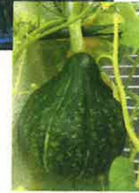
豊作だったかぼちゃ