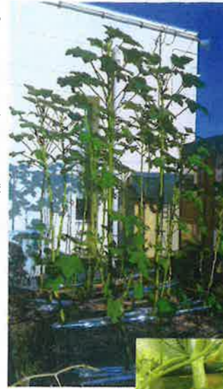
←森になりそうなオクラ

このプログラムでは、屋外活動での運動効果、一緒に作業することによるコミュニケーション能力のアップを目指しています。もちろん、一番の目的は美味しい野菜を食べることです♪今まで、「野菜は嫌々食べていた、料理はしない！」という利用者さんも、自分から挑戦するきっかけとなっています。とにもかくにも、不足しがちな野菜を、食事に取り入れるきっかけになればそれでよし！農作業のプログラ